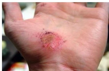
Imagen 2: Abrasión producida por roce